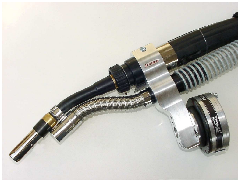
Brenner ausgerüstet mit ROPAS-Absaugdüse Typ MONOFLEX (geringe Störkonturen)